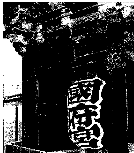
令和5年稲沢市長賞(中学校3年)

はだか祭で知られる尾張総社の国府宮では、子どもたちの郷土愛を育むため今年も「国府宮を描く会」を下記の通り開催いたします。奮ってご参加くださいますよう、ご案内申し上げます。