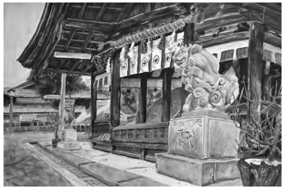
平成29年 国府宮宮司賞(中学3年生)

はだか祭で知られる尾張総社の国府宮では、子供達の郷土愛を育むため本年も「国府宮を描く会」を下記の通り開催いたします。奮ってご参加くださいますよう、ご案内申し上げます。