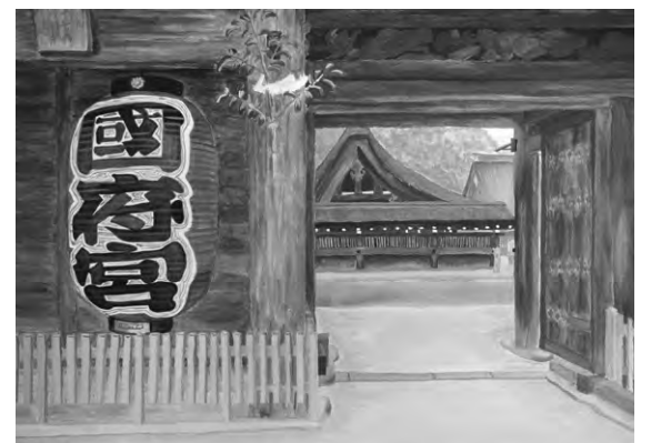
平成29年 稲沢市長賞受賞作品(中学2年生)